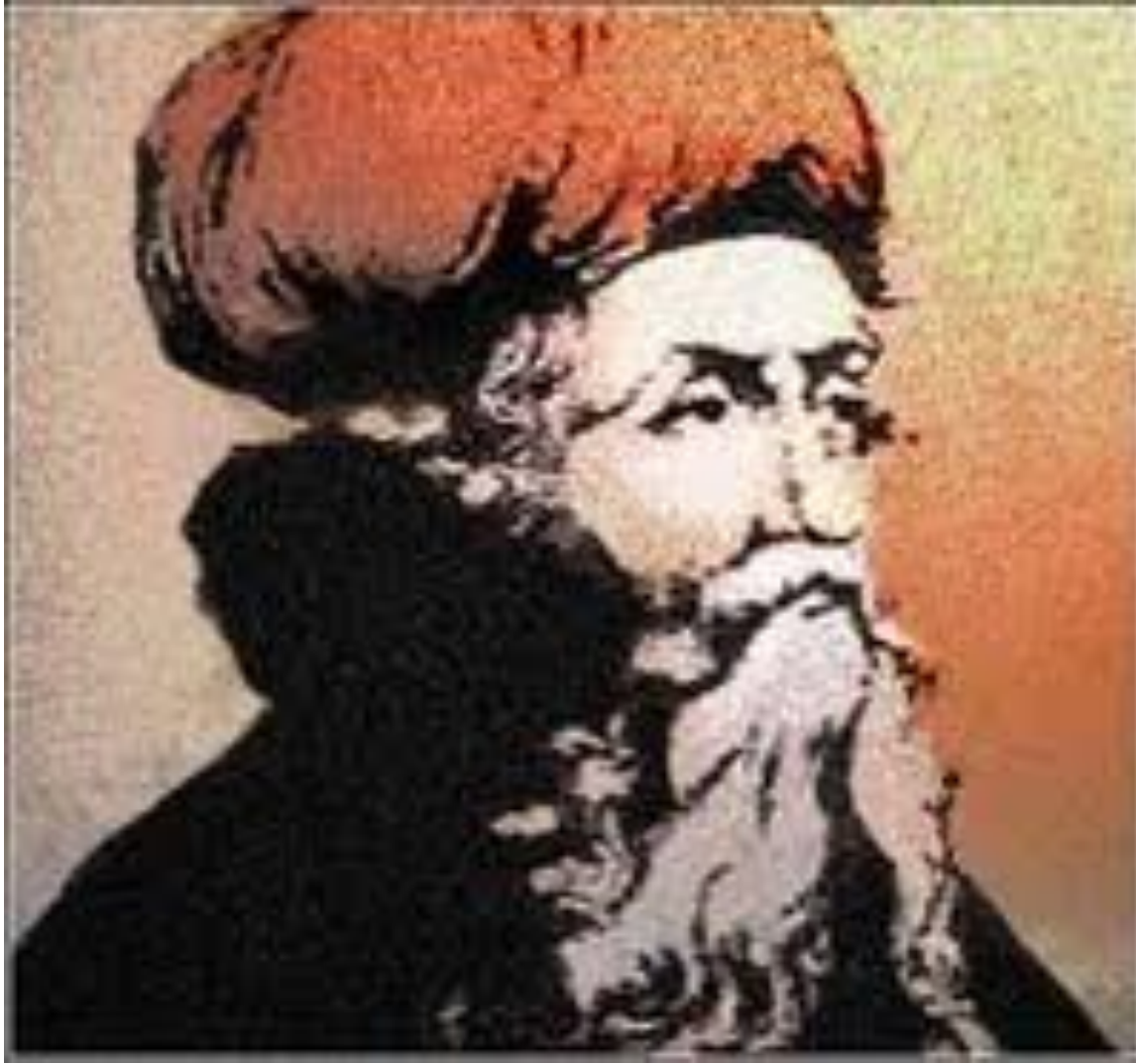
"الشيخ الاكبر" محي الدين بن عربي